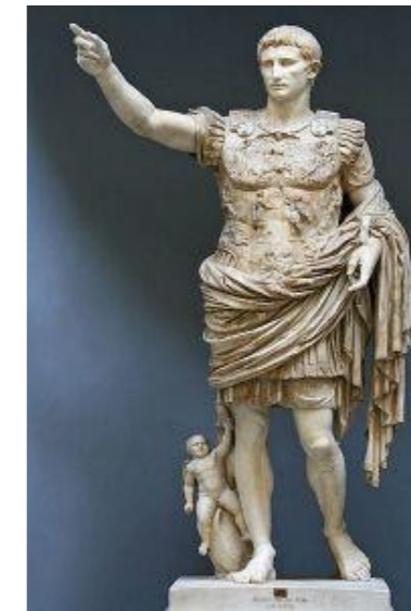
Augustus fra Prima Porta, statue i Chiaramonti-museet, Roma

har bevarats) över allt han uppnått, och vid sin död år 14 e.Kr. förklarades han av senaten som en gud – dvs. värd att tillbes av romarna. Den åttonde månaden i den romerska kalendern fick sitt nya namn – augusti, efter den store kejsaren. Hans adoptivson Tiberius tog över tronen och var kejsare vid tiden för Jesu död och uppståndelse.